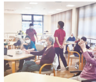
こがデイサービス野伏間(1F)

1階には「こがデイサービス野伏間」を併設しており、徒歩すぐの 場所には「野伏間クリニック通所 リハビリテーション」もあります。 介護スタッフ、理学療法士、看護 師など、チームで入居者さまの身 体づくりをサポートするほか、介 護浴槽で湯船にゆったりつかつて 癒しの時間も楽しめる環境です。